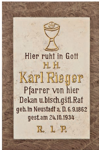
Inscription auf dem renovierten Grabstein im ehemaligen Friedhof.

wird vermutlich erst durch ihren Unfall in den Blickwinkel seiner Aufmerksamkeit gerückt sein, also ab dem 4. Februar 1901. Bald erkannte er ihre Berufung und begleitete sie behutsam und geduldig auf ihrem inneren Weg. Er war ihr Beichtvater, gab ihr aber auch immer wieder