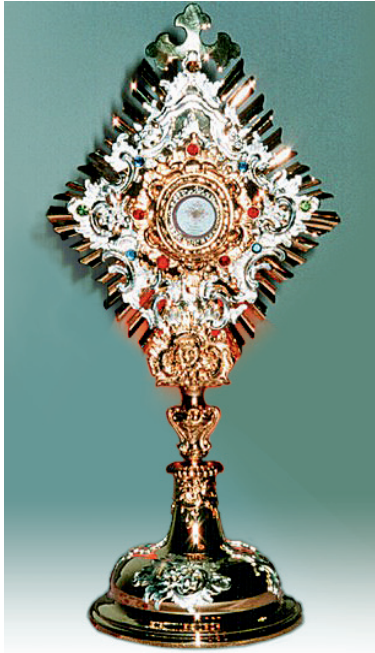
Endgültige Anna-Schäffer-Reliquienmonstranz, die in die Gnadenkapelle aufgenommen wird

Die Anwesenheit ihrer Reliquie wird ihre Verehrerinnen und Verehrer bestimmt auch dort ermuntern, sich mit ihren Anliegen und Sorgen an sie zu wenden. (fj)